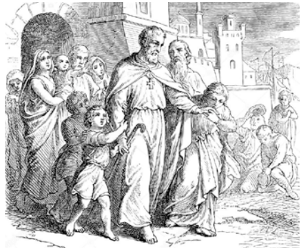
Athanase envoyé en exil

Ses ennemis n'avaient pas désarmé. Sur l'instigation d'Eusèbe, ils déposèrent Athanase une deuxième fois, lors d'un synode réuni à Antioche en 339. Ils imposèrent à sa place un certain Grégoire de Cappadoce. Athanase s'étant enfui à Rome, il y trouva un soutien auprès du pape Jules I er , qui, dans un synode, le disculpa totalement. Dans la capitale de la chrétienté, Athanase eut l'occasion de fréquenter des cercles de fidèles épris de spiritualité qu'il fascina par ses récits sur le monachisme florissant dans le désert égyptien. Il put retourner à sa chère ville d'Alexandrie en octobre 346, après la mort de l'usurpateur Grégoire. Quatre ans plus tard, le fils de Constantin, Constance, un ennemi d'Athanase, devint le seul empereur de l'Occident et de l'Orient. Constance convoqua deux synodes, à Arles en 353 et à Milan en 355, pour condamner Athanase et imposer au diocèse d'Alexandrie un nouvel intrus, Georges de Cappadoce. Dans ces deux synodes, l'empereur fut personnellement présent. Athanase fut condamné par la grande majorité des Pères conciliaires. Seul un petit groupe d'entre eux refusa de signer cette condamnation injuste. Parmi eux, outre le pape Libère, il faut mentionner les évêques Eusèbe de Verceil, Denys de Milan, Osius de Cordoue, Hilaire de Poitiers. Ces