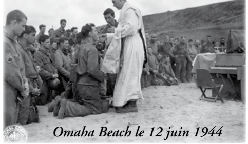
Omaha Beach le 12 juin 1944

spirituellement dans son pèlerinage terrestre et comme gage de sa destinée aux noces célestes de l'Agneau (Ap XIX, 9), – l'on commence aussi à comprendre la profonde révérence qu'il faut pour traiter et recevoir la sainte Eucharistie. Ainsi, au long des siècles, les fidèles ont fait la genuflection en arrivant devant le Saint Sacrement et se sont agenouillés en adoration devant la Présence Réelle de Notre Seigneur dans la sainte Eucharistie. De la même façon, sauf circonstances extraordinaires, seul le prêtre ou le diacre touchait la sainte Hostie ou le calice contenant le Précieux Sang. Une des impressions les plus frappantes de mon enfance est cette grande délicatesse envers le Saint Sacrement que m'ont enseignée mes parents, notre curé et les religieuses de nos écoles catholiques. Je me souviens particulièrement des avertissements minutieux qui m'ont été donnés, avant d'être admis à aider le prêtre comme servant de messe, sur la révérence due à la Présence Réelle.