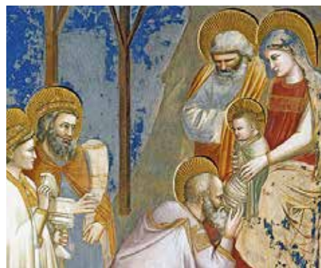
L'Adoration des Mages , 1303-1305, de Giotto. Fresque, Padoue (Italie)