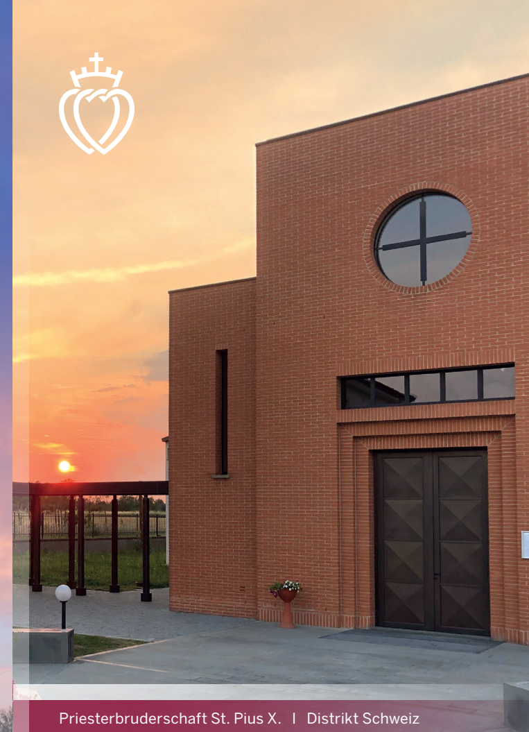
Priesterbruderschaft St. Pius X. | Distrikt Schweiz