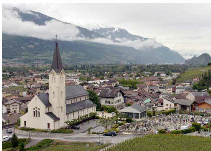
Saint-Léonard en Valais (Suisse)

En Allemagne, Galeran de Bamberg, évêque de Naumbourg a largement diffusé la Vita qu'il avait eu le loisir de copier pendant son séjour au monastère de Noblat vers 1106 ; en 1220, le manuscrit cistercien du Grand livre de légendes autrichien de Zwettl en Basse Autriche accentue cette diffusion.