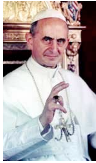
Le pape Paul VI

Il faut reconnaître que le pape Paul VI a posé un sérieux problème à la conscience des catholiques. Ce pontife a causé plus de dommages à l'Eglise que la Révolution de 1789. (...) Mais le problème n'est pas si simple de savoir si un pape peut être hérétique. Bon nombre de théologiens pensent qu'il peut l'être comme docteur privé mais non comme docteur de l'Eglise universelle. Il faudrait donc examiner dans quelle mesure Paul VI a voulu engager son infaillibilité dans des cas comme ceux que je viens de citer.