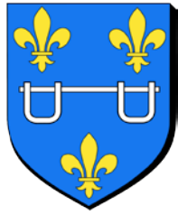
Armoiries de la ville de Saint-Léonard-de-Noblat (France)

On les retrouve à la collégiale, et les entraves figurent sur les armoiries de la commune française de Saint-Léonard-de-Noblat (mais pas sur celles de la commune du Valais).