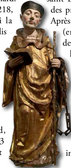
Statue de saint Léonard provenant de la cathédrale Saint-Nicolas de Fribourg (musée d'art et d'histoire, Fribourg)